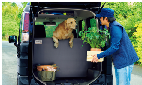
遊びに仕事に空間自由自在。新しい使い方を実現