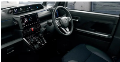
上質感がアップしたカスタムのインテリア