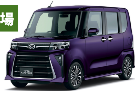
フロントフェイスが大幅に変更されたカスタム

Mr.車manではデザインや内装・機能等がわかる冊子をお配りしており、早期予約を受け付けております。是非お気軽にお問い合わせください。