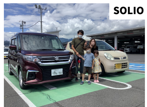
S様 スズキ ソリオ