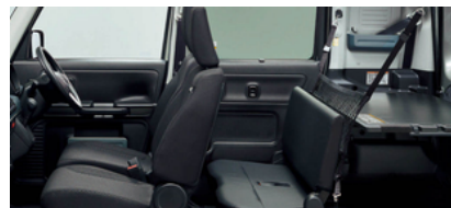
車内空間を自由にアレンジできるマルチボード搭載