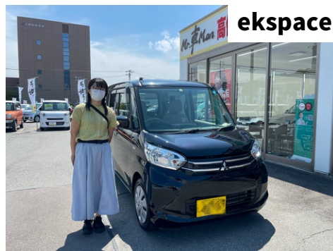
F様 三菱 ekスペース

この度はMr.車manでお車をご購入頂き誠にありがとうございます！ スタッフ一同全力でカーライフをサポートいたします。 未永いお付き合いのほどよろしくお願ひ申し上げます！