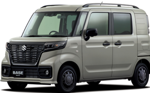
スペーシアをベースに商用車と乗用車のイイトこ取り