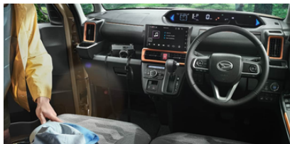
多機能で便利なファンクロスインテリア