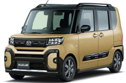
アウトドアモデルの"ファンクロス"