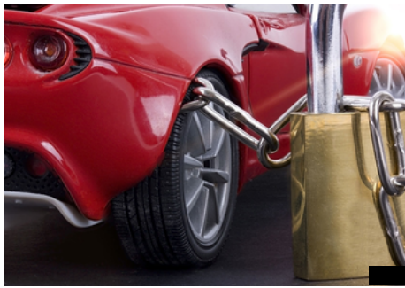
こんな風にてチラシが挟まっていた際は要注意！