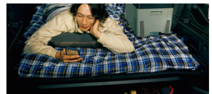
大人2人でもゆったり快適な車中泊が楽しめます