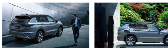
写真は新色「ムーンストーングレーメタリック/ブラックマイカ」

インテリアではナビ画面が12.3インチに拡大され、「MITSUBISHI CONNECT」の機能強化によりGoogle検索やストリートビューが利用可能になっています。最上級グレードの「Pエグゼクティブパッケージ」には、専用内装色「ブリックブラウン」やセミアニリンレザーのシートが採用され、高級感が高められています。また、これまでは下位グレードに限定されていた5人乗り仕様が全グレードで選べるようになりました。さらに、ヤマハと共同開発したオーディオシステムを搭載し、最高級仕様の「ダイナミックサウンドヤマハアルティメット」は計12基のスピーカーとデュアルアンプを備え、上質な音響体験を提供します。価格は526万3500円から。Mr.車manでも販売可能です。詳しくはスタッフまでお問い合わせください。