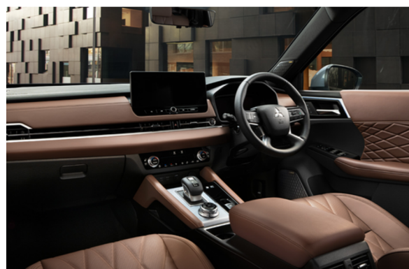
細部の造り込みにこだわり、質感を徹底して高めたインテリア

エクステリアではフロントグリルのデザインをフラットに変更し、スキッドプレートやリアランプを立体的かつモダンな仕様に。新色「ムーンストーングレーメタリック」も追加されました。